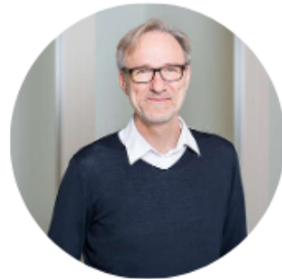
René Heise Support Digitales Systemmanagement